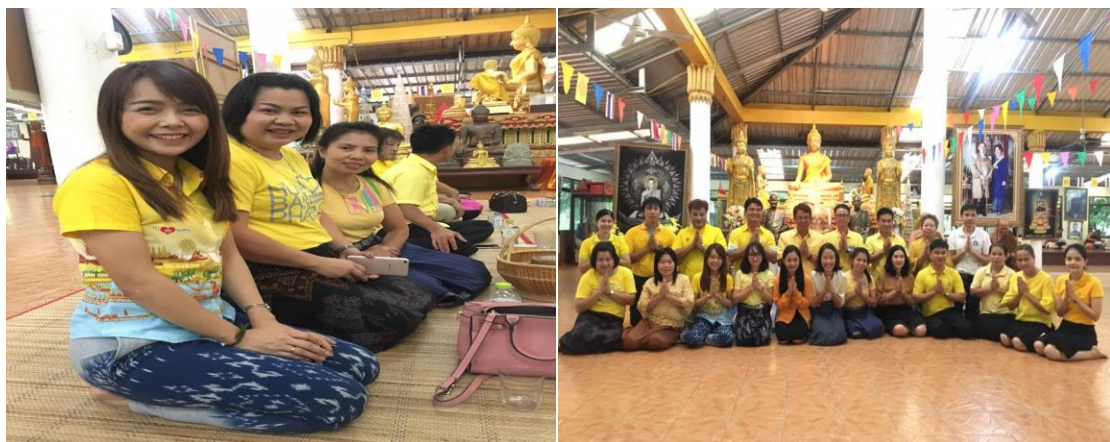
ผลการดำเนินการ

มีการทำบุญตักบาตร และฟังพระเทศนา ณ วัดบ้านโคกยาว ม.๓ และวัดโคกยาว ม.๑๐ตำบลโพธิ์ทอง