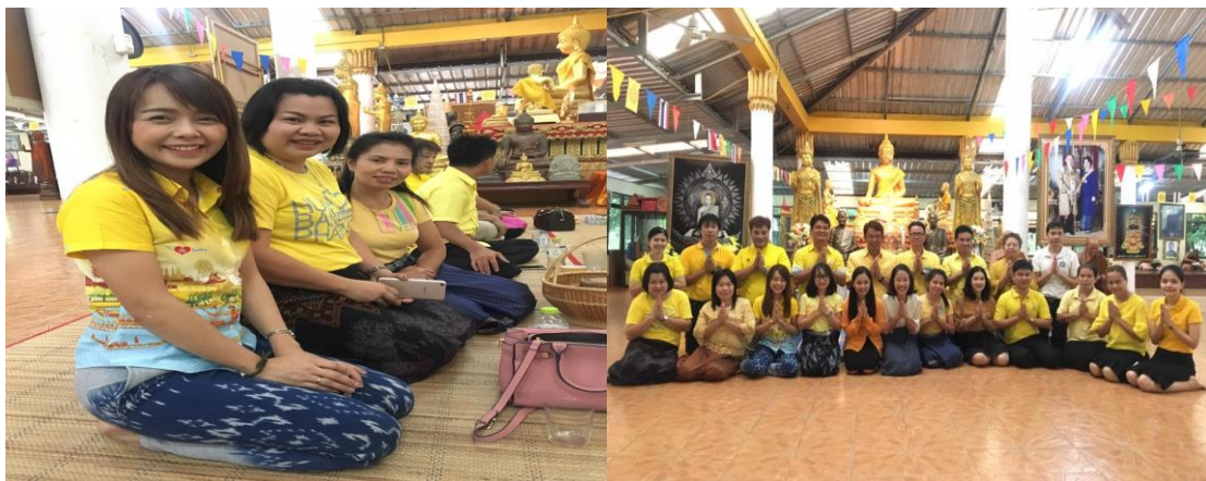
ผลการดำเนินการ

มีการทำบุญตักบาตร และฟังพระเทศนา ณ วัดบ้านโคกยาว ม.๓ และวัดโคกยาว ม.๑๐ตำบลโพหนอง